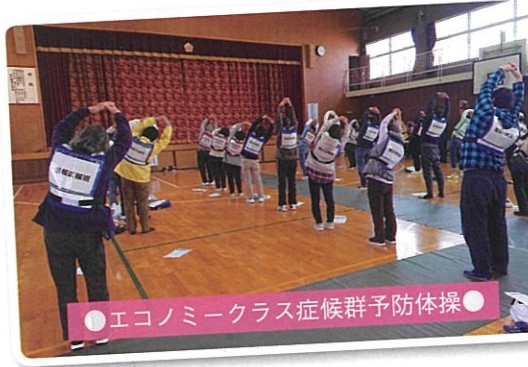
●エコノミークラス症候群予防体操●